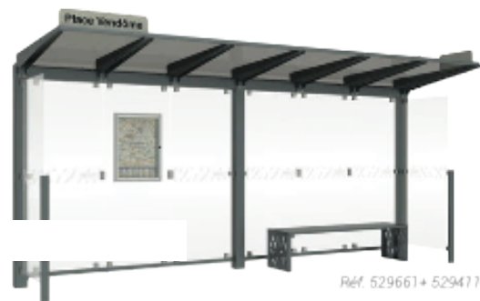
Ref. 529661+ 529477