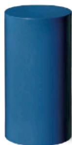
Ø 273 mm HS 510 mm