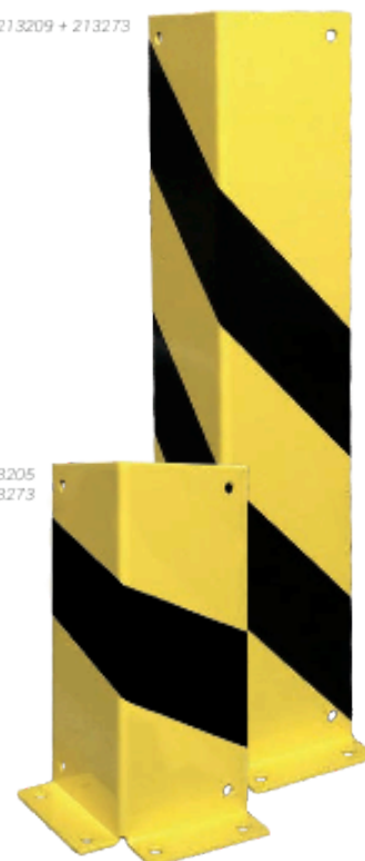
Ref. 213205 + 213273